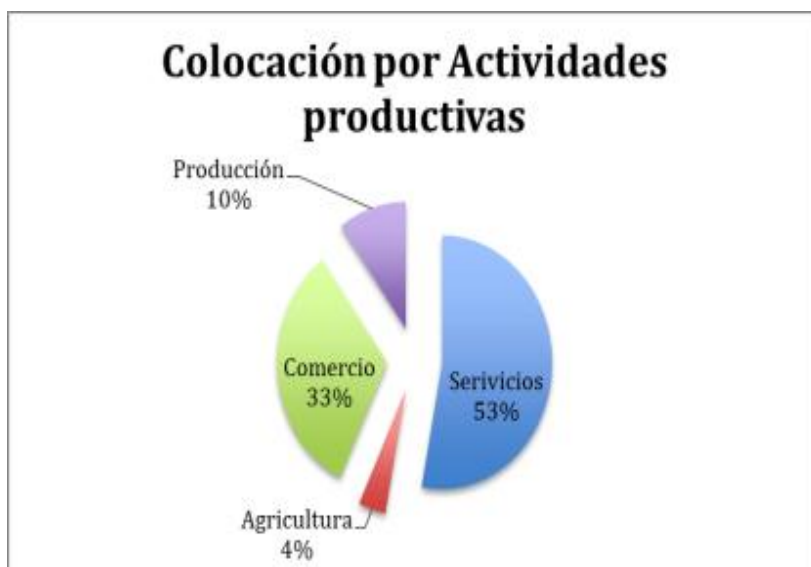
Figura 1. Colocación por actividades productivas

De la misma manera, el Fondo de Garantía alcanzará USD. 170 millones, lo cual permitirá acceso al crédito en una primera fase por alrededor de USD. 1.100 millones. Estos fondos crediticia en el mundo han demostrado ser efectivos mecanismos para fortalecer los