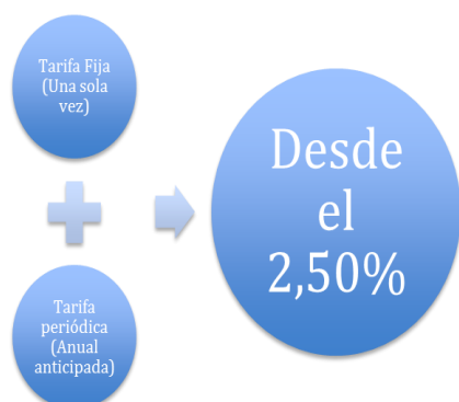
Figura 2. Tarifas del Fondo de garantía

para el usuario final, como para las Instituciones Financieras, y de igual forma para la economía ecuatoriana.